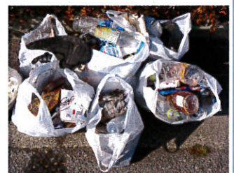
(3月末東口駐車場にて)

気が付いたら拾いましょう。私たち一人ひとりの行動が、環境美化と施設及び職員のイメージアップにつながります。